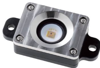
外形寸法 External dimensions

With mounting holes for embedded devices