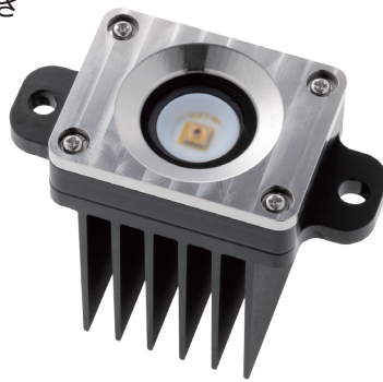
外形寸法 External dimensions

With mounting holes for embedded devices